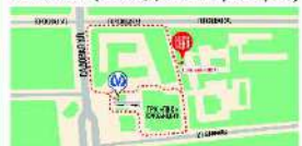
Схема прохода на ярмарку