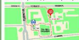
Схема прохода на ярмарку